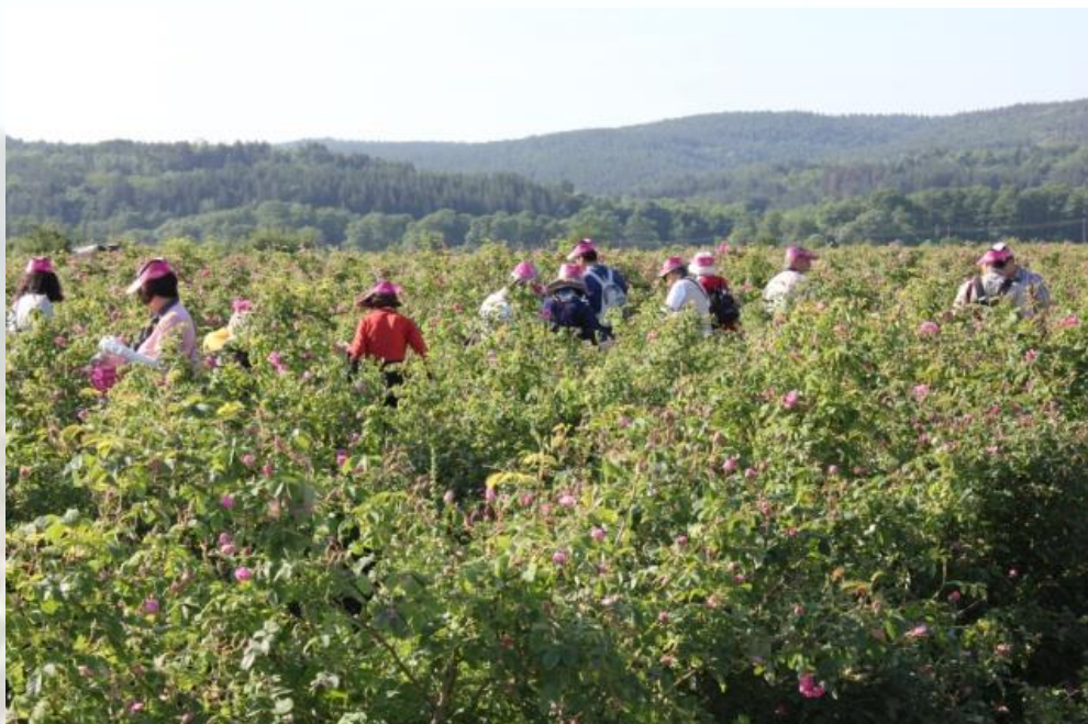
Die jährliche Rosenernte in den Feldern von Kazanlak!

Begleiten Sie uns zu den duftenden Rosenfeldern Bulgariens, seinen geheimnisvollen Klöstern und den antiken Ausgrabungen der Thraker!