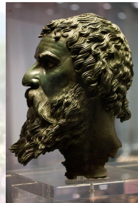
Bronzekopf von Seuthes III., Thrakerfürst, 4. Jhdt. v. Chr.

Tanzen und feiern Sie mit uns zu den bulgarischen Rhythmen!