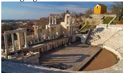
Plovdiv, antikes Amphitheater

Anschließend, Fahrt nach Plovdiv(28km) - europäische Kulturhauptstadt 2019 - und Rundgang in der Altstadt - ein wunderschönes Ensemble von Häusern aus der Zeit der bulgarischen Wiedergeburt (Mitte des 18. bis Ende des 19. Jh.) erwartet Sie!